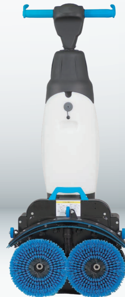
イートレール背面