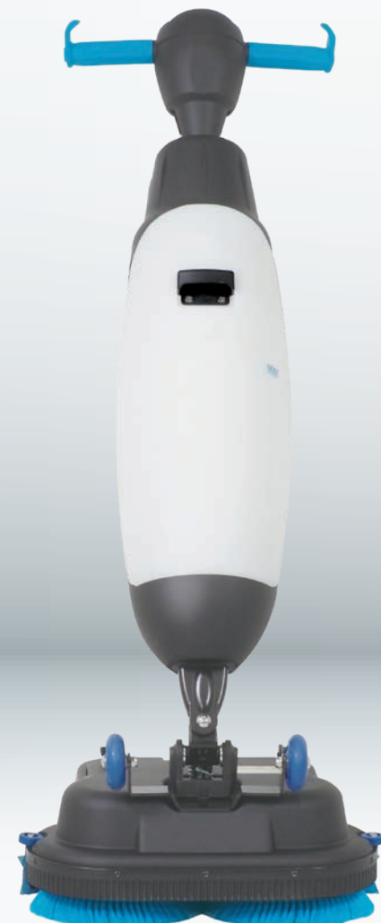
イートレール正面