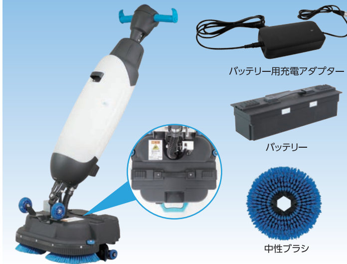
バッテリー用充電アダプター