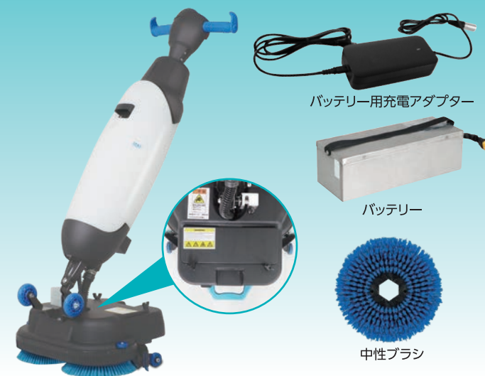
バッテリー用充電アダプター