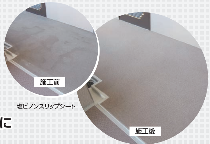
塩ビノンスリップシート