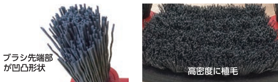
ブラシ先端部 が凹凸形状

エンボスにフィットするようブラシ先端部が凹凸形状に。 また、高密度に植毛されているため極細毛でもコシが強く 小さなくぼみの汚れもしっかり掻き出します。