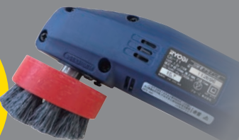
グラインダーは別売となります。 (RYOBI CG-11)

天井面や階段 植栽等の薬品が 使用できない場所に! 水だけで汚れを除去! トイレや狭い場所に 最適です!