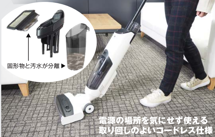
固形物と汚水が分離