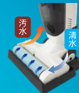
セルフクリーニング