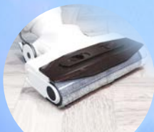
クッションフロア