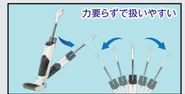
力要らずで扱いやすい