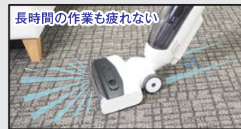
長時間の作業も疲れない