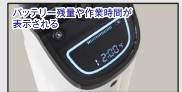
バッテリー残量や作業時間が表示される