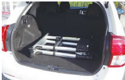
車のトランクにもすっきり収納