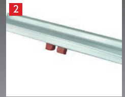
ワンタッチロック解除レバー