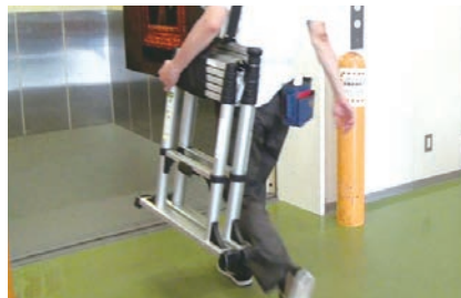
持ち運びが安全、ラクラク