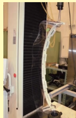
衝撃性テスト写真

サイズ: 12・14・15・17インチ (15・17インチはイノベーター用) 材質: フレーム/超高耐衝撃性ABS樹脂材、カバー/塩ビ ※補修用に全ての部品が一個から供給できます。