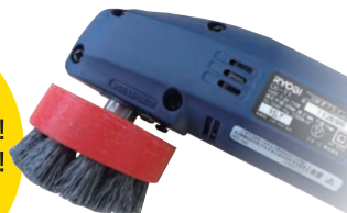
グラインダーは 別売となります。 (RYOBI CG-11)

天井面や階段 植栽等の薬品が 使用できない場所に! 水だけで汚れを除去! トイレや狭い場所に 最適です!