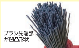
ブラシ先端部が凹凸形状

エンボスにフィットするようブラシ先端部が凹凸形状に。また、高密度に植毛されているため極細毛でもコシが強く小さなくぼみの汚れもしっかり掻き出します。