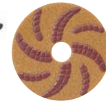
チーターパッド ステップ1~4