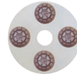
チーターバック+スペーサーパッド ステップ1~4