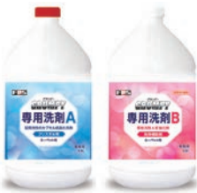
グランピー専用洗剤A・B 1ガロン2本/セット