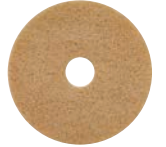
モンキーパッド#11000 ステップ5