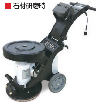
ウェイト+ウェイト取付けブラケット装着例