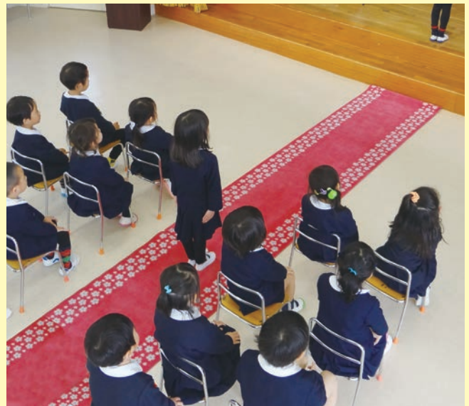
大切な卒業式や入園式、桜の花道マットが思い出に残る演出をお手伝いします。

3m以上の長さが必要な場合、上記写真のように裏面にマジックテープ等を使い、マット同士をつなぎ合わせることで対応できます。