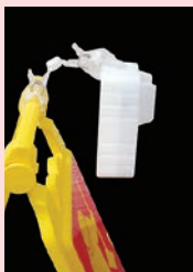
専用ケース取付けクリップ装着例

設置場所に穴をあけずに固定できるワンタッチクリップ式。約25mmの厚さ・径の場所に挟んで固定することができます。