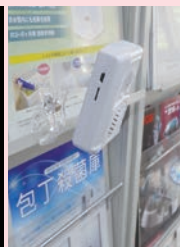
本体直付けクリップ装着例